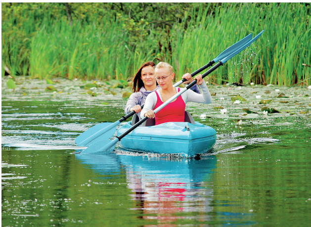
Paddeln auf den Glubigseen