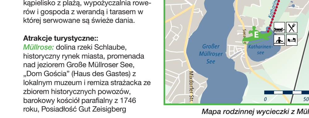
Mapa rodzinnej wycieczki z Müllrose

Atraksje turystyczne: Müllrose: dolina rzeki Schlaube, historyczny rynek, promenada nad jeziorem Große Müllrose See, „Dom Gości” (Haus des Gastes) z lokalnym muzeum i remizą strażacką ze zborem historycznych powozów, barokowy kościół parafialny z 1746 roku, Posiadłość Gut Zeisigberg