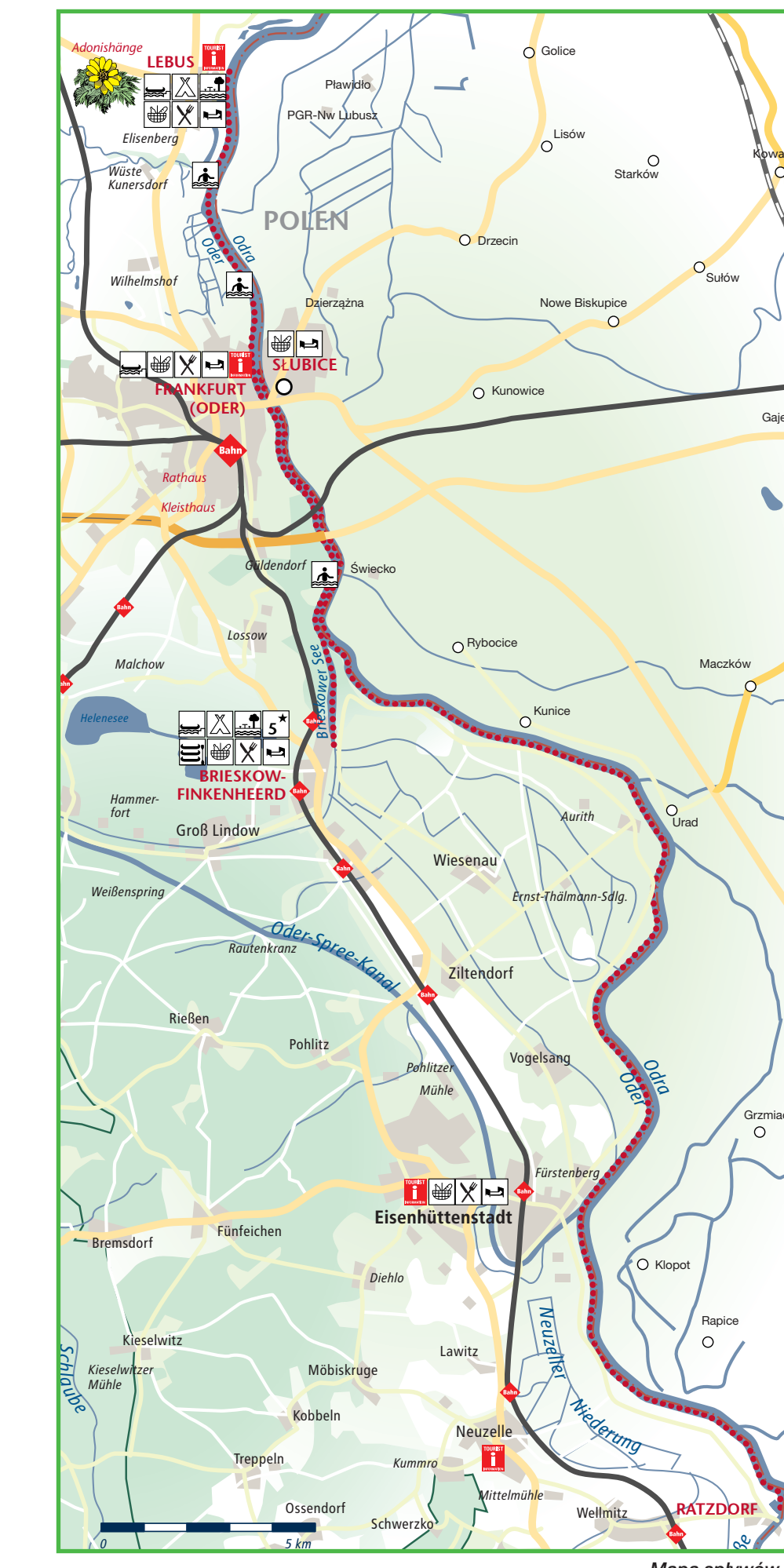
Mapa spywu Odry

Spyw Odry z Ratzdorf do Słubic Początkiem 35 kilometrowego spywu jest miejscowość Ratzdorf, historyczna wioska rybacka położona w interesującym krajobrazowo ujściu Nysy. Do Ratzdorf możecie Państwo dotrzeć na przykład autobusem, który zabiera Państwa z miejscowości Wermitz. Już w chwili po zwiadowaniu kajaki możecie Państwo podziwiać piękną nadbrzeżną przyrodę. Po krótkim czasie miniecie Państwo ruiny mostu, który został wysadzony pod koniec II Wojny Światowej. Zaraz za mostem leży, trudna do zauważenia z poziomu wody, najwęższa bociana wioska w zachodniej Polsce Kloppt. Po przeciwniej stronie rozciągają się Fürstenberg, dzielnica Eisenhüttenstadt; przy bulwarze „Bolliwerk” możecie Państwo komfortowo przycumować. W drodze w Słubice będziecie Państwo mieli możliwość zobaczenia ruin elektrowni w Vogelsang, która nie weszła do eksploatacji. Za zakolem, po polskiej stronie wzdłuż brzozi rzeki rozciągają się grzązkiwa i dopływy, które nadają się do kąpieli wodnych. Wioskując dalej z nurtem rzeki osiagniecie Państwo miejscowości Aurich po niemieckiej i Urad po polskiej stronie, które podzieliła granica. Po dalszych 4 kilometrach, mijając po drodze Kunze, osiagniecie Państwo Brieskower Kanal. Przed 350 laty pierwszy połączenie Odry i Spree, niedroze od zakończenia II Wojny Światowej. Na południowym krańcu jeziora Brieskower See znajduje się miejsce