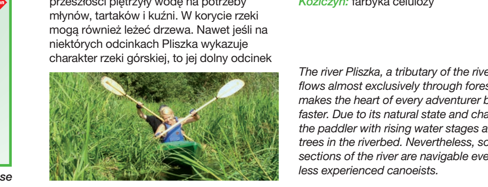
The river Pliszka, a tributary of the river Oder, flows almost exclusively through forests and makes the heart of every adventurer beat faster. Due to its natural state and challenges the paddler with rising water stages and lying trees in the riverbed. Nevertheless, some sections of the river are navigable even for less experienced canoeists.

Atraksje turystyczne: Gądków Wielki: wieś będąca do połowy XIII w. własnością Zakonu Templariuszy, a następnie Zakonu Joannitów Sądów: ruiny młyna i elektrowni wodnej Koziczyn; farbyka celulozy