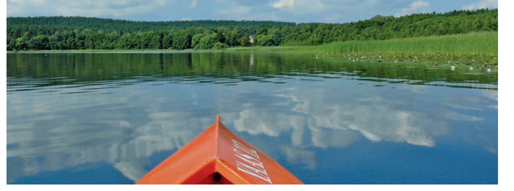
Nad jeziorem Schamützelsee