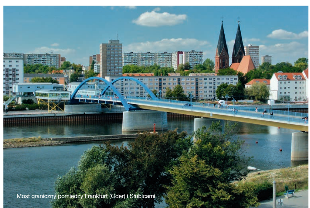
Most graniczny pomiędzy Frankfurt (Oder) i Słubicami

If you are traveling by canoe on the river Oder, please note that your canoe carries the flag of the associated country and an associated plate. You may always carry your ID documents (ID card or passport) with you.