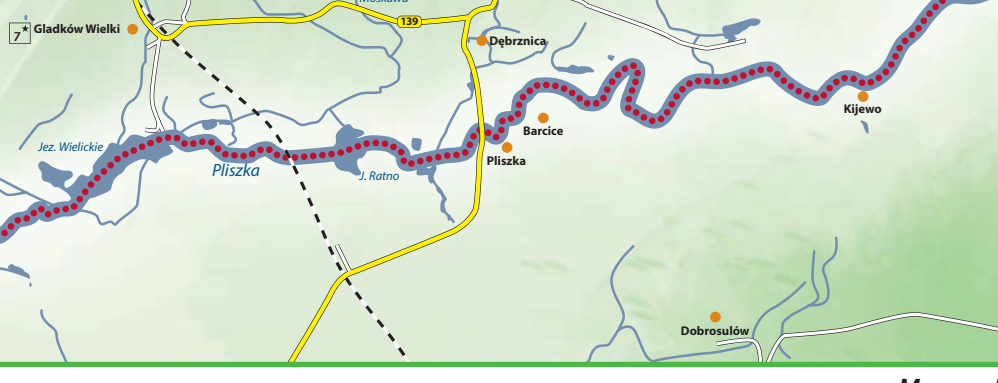
Mapa spywu Pliszka

Atraksje turystyczne: Klasztor Neuzelle: dawna opactwo klasztoru cystersów, kościół Najświętszej Marii Panny, kościół Świętego Krzyża, ogród z oranżerią, krzyżanek, przykasztoy browar, gorzelnia, pierwsze w Europie kąpiele w piwie Eisenhüttenstadt Oder-Spreewald: Kanał z mostem na wachach, Muzeum Pożarnictwa, Centrum Dokumentacji Kultury Dnia Codziennego NRD, Mielnizhafen (port jachtowy), zabytkowe śródmieście, Zagroda Kultury Fürstenberg Frankfurt (Oder): Kleinstmuseum, Kościół Mariacki, most miejski na Odrze, Hala Koncertowa Słubice: Collegium Polonicum, stadion sportowy, Galeria „Okno”, park wypoczynkowy, lasy łęgowe Lebus: szlak templatyczny w postaci kwiatów miłki wiosennej w Naturchutzgebiet „Oderberge Lebus” (Rezerwacja Ścisłej Ochrony Przyrody „Odrzańskie Wzgórza Lebusz” kościół miejski, grzebieł górski nad Odą, Muzeum Haus Lebusser Land