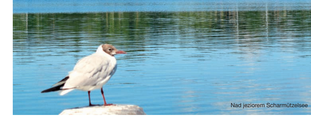
Nad jeziorem Schamützelsee

Atraksje turystyczne: Müllrose: dolina rzeki Schlaube, historyczny rynek, promenada nad jeziorem Große Müllrose See, „Dom Gości” (Haus des Gastes) z lokalnym muzeum i remizą strażacką ze zborem historycznych powozów, barokowy kościół parafialny z 1746 roku, Posiadłość Gut Zeisigberg